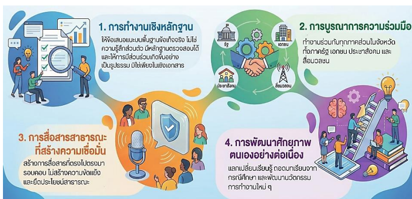
“แนวนโยบายหลักของการปฏิบัติงานของ ก.ธ.จ.”

๔. การพัฒนาศักยภาพตนเองอย่างต่อเนื่อง การปฏิบัติหน้าที่ของ ก.ธ.จ. ต้องอาศัยความรู้ ทักษะ การวิเคราะห์ และความกล้าหาญทางจริยธรรม ควรเปิดโอกาสให้มีการแลกเปลี่ยนเรียนรู้อย่างต่อเนื่อง การถอดบทเรียนจากกรณีศึกษาจริงในพื้นที่ การนำเสนอแนวคิดเชิงนวัตกรรม และการร่วมกันออกแบบแนวทางการทำงานรูปแบบใหม่ โดยให้การสัมมนาเป็นเวทีสำหรับการสร้างความร่วมมือและกำหนดทิศทางอนาคตของ ก.ธ.จ. อย่างเป็นรูปธรรม