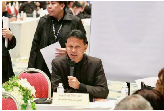
วิทยากรประจำกลุ่ม : รองหัวหน้าผู้ตรวจราชการสำนักนายกรัฐมนตรี (นายสุวิทย์ วิจิตรโสภาคย์)