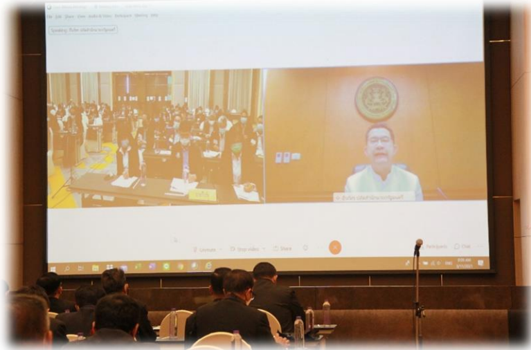
การมอบนโยบายผ่านระบบการประชุมทางไกลผ่านจอภาพ (Video Conference) โดยปลัดสำนักนายกรัฐมนตรี (นายธีรภัทร ประยูรสิทธิ)